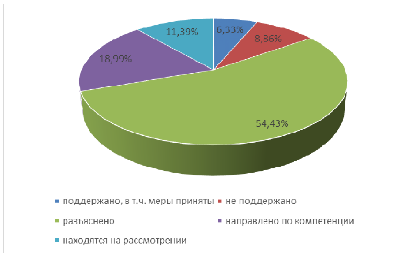
Рисунок 2 - Результаты рассмотрения обращений (письменные+ устные)

Повторных обращений в 4 квартале 2023 г. в администрацию Россошанского муниципального района не поступало.