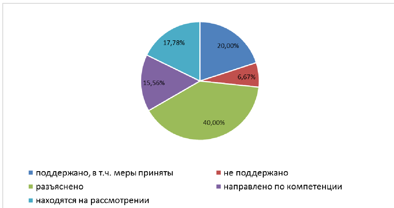
Рисунок 1 - Результаты рассмотрения письменных обращений

Принято граждан на личном приеме – 9 человек (все обращения устные). Из них рассмотрено по существу – 9 обращений: 2 обращения рассмотрено с результатом «поддержано», по 7-ми обращениям даны разъяснения, в том числе в письменном виде.